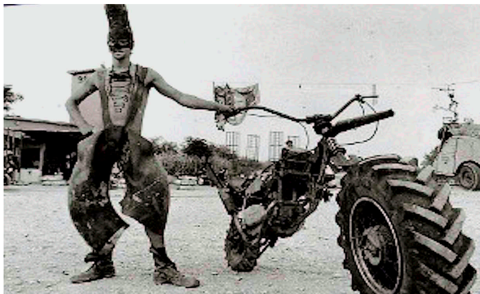
Fig. 4 - I Mutoid Waste Company