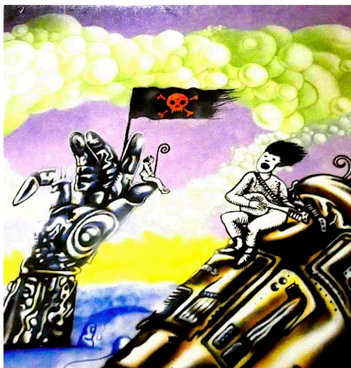
Fig. 1 - Murale di Pirateria di Porta (particolare)

« Nel grande hangar d'ingresso quattro vaste pareti sono tutte affrescate in stile hip hop. Anche i pilastri verticali che le suddividono come fogli di quaderno sono stati usati. Vi è rappresentato una specie di enorme gigante, una macchina umana fatta a pezzi, scardinata nella sua unità fisica che ha incorporato carni e metalli, chip e plastiche. Il volto è doloroso e interdetto, come sorpreso da una fine atroce e immeri-