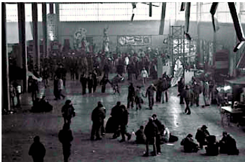
Fig. 2 - Rave alla FINTECH